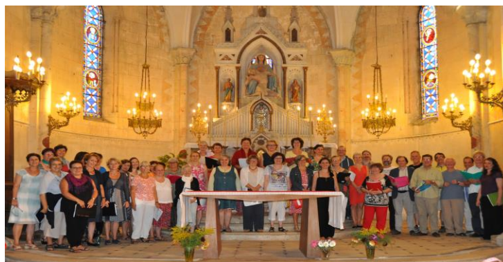
Master Class - Eglise Saint Saturnin

***** SAINTE JEAN D'ANGELY - STAGE ETE 2015 EN PHOTOS