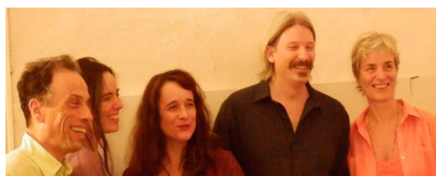
Des formateurs satisfaits après le concert final